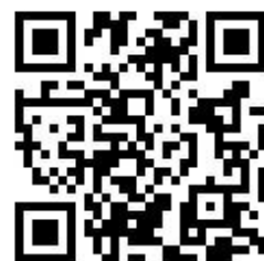
研修班のメルアド

お名前・登録番号・住所 (市区町村迄でそれ以下は省略して下さい) 連絡先 (Mail) と、ご意見やご提案・ご要望をお願いします。