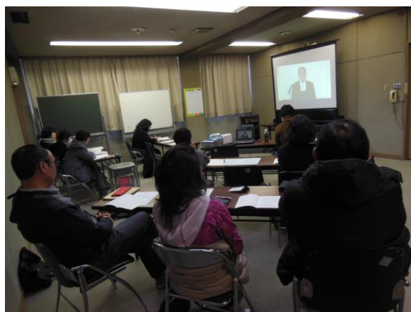
コンプライアンスと倫理研修 (DVD)風景